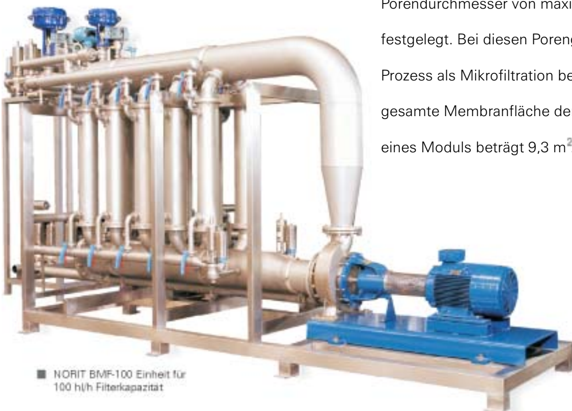
■ NORIT BMF-100 Einheit für 100 h/h Filterkapazität

Porendurchmesser von maximal 0,5 \mu\text{m} festgelegt. Bei diesen Porengrößen wird der Prozess als Mikrofiltration bezeichnet. Die gesamte Membranfläche der Filterfläche eines Moduls beträgt 9,3 \text{m}^2 .