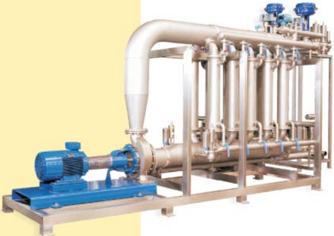
■ NORIT BMF-100 Einheit für 100 hl/h Filterkapazität

Cross Flow Geschwindigkeit: 2 m sec System Druck: 3 bar g Trans Membran Druck: 0,5 ≤ 1,5 bar g Druckabfall bei Zirkulation: 1-1,5 bar g Strömungsgeschwindigkeit: 107 l/m 2 /h Biertemperatur: 0 °C