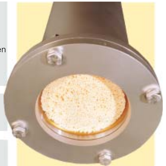
■ Ein NORIT Bier Filter Membran Modul

Geschlossenes System / Keine Sauerstoffaufnahme Kurze Umschaltzeiten / Minimaler Bierverlust Vollautomation / geringer Arbeitsaufwand Leicht erweiterbares modulares System Einsparungen durch hohe Wirtschaftlichkeit (Lohnkosten) Hohe Flexibilität